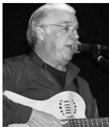
Luis Enrique Mejía Godoy

Un abala en la selva de Zinica penetró en tu recio corazón de santo y estalló tu sangre en nuestras vidas como una gigante bomba de contacto. Desbordante de amor hacia los hombres,