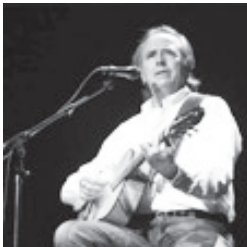
Joan Manuel Serrat