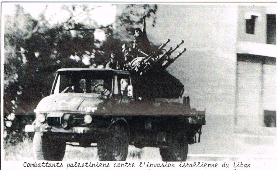
Combattants palestiniens contre l'invasion israélienne du Liban

Depuis que l'humanité existe, il existe des guérillas. En Europe,