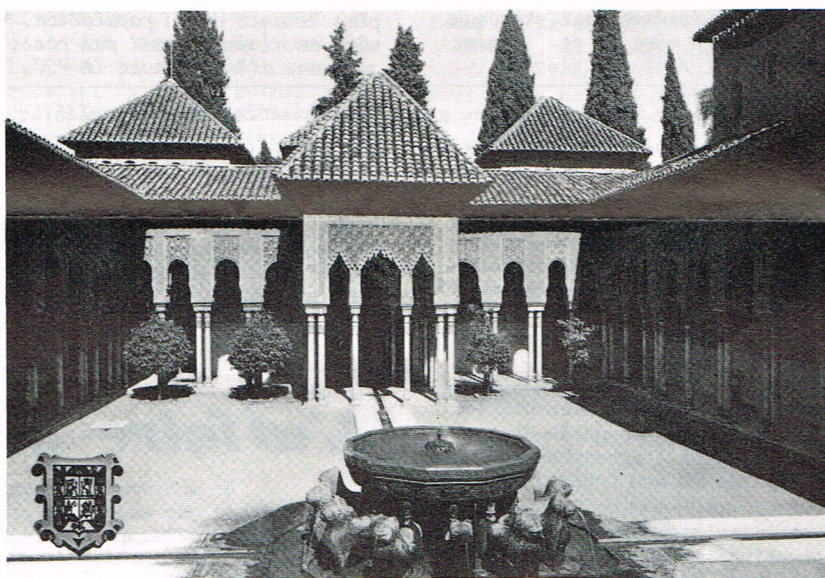
GRENADÉ: Les jardins de l'Alhambra. La Cour des Lions

Ces études sont une contribution à l'interprétation matérialiste dialectique de l'histoire, qui était pour J. Posadas, un instrument indispensable pour comprendre le cours actuel de l'histoire dans la lutte pour le progrès humain.