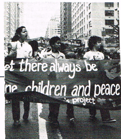
Été 1982. Les habitants de Harlem protestent contre la poursuite de la course aux armements aux Etats-Unis.

Il faut continuer les mobilisations pour la paix et contre l'installation des missiles, en tenant compte de l'échéance de la fin 1983. Que toutes les organisations de gauche en Belgique interviennent dans ces mobilisations: parti communiste, parti socialiste, mouvement ouvrier chrétien, mais surtout les syndicats, pour donner l'opinion de la classe ouvrière sur ces problèmes, qui est liée à la lutte contre le gouvernement de droite qui participe aux plans de guerre de l'impérialisme.