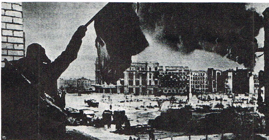
LA BATAILLE DE STALINGRAD DU 17.7.42