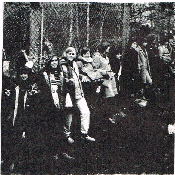
Un aspect de l'énorme manifestation de femmes contre les missiles Cruise à Greenham Common en Angleterre.

Pendant ces derniers jours, on a beaucoup parlé d'Hitler et de la montée du nazisme, de la guerre 40-45, pour amener les gens à penser et à dire : "Après tout, la démocratie occidentale est ce qu'il y a de moins mauvais et il faut donc la défendre. Mais à aucun moment, la complicité n'a pu être soutenue entre Hitler et le nazisme et l'Union Soviétique d'aujourd'hui! Dans la prochaine guerre, il est clair pour les masses que ce ne sont pas les Soviétiques qui vont jouer le rôle d'envahisseurs en Europe! Par contre, les comparaisons sont sorties tout de suite entre les exactions du fascisme et le comportement de l'impérialisme américain et mondial aujourd'hui: Israël contre le Liban et la révolution palestinienne, l'Afrique du Sud contre l'Angola, le Mozambique et le peuple de Namibie, les Etats Unis contre Cuba, le Nicaragua, le Salvador et toutes les masses d'Amérique Latine. Et les campagnes régulières lancées par les TV, radios et presse mondiales contre la Pologne, l'Union Soviétique, la Bulgarie, l'Afghanistan etc... ne font pas long feu, et n'ont pas du tout l'écho escompté. La fameuse filière bulgare-soviétique qui était destinée à assassiner le Pape en Italie s'est réduite à rien, comme le grand danger de chute du satellite soviétique.