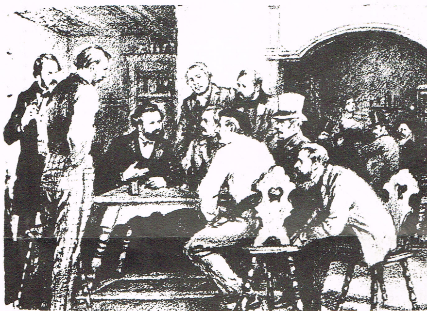
Marx, en noir, assis, et Engels, debout derrière lui, parmi des socialistes, à Paris. Automne 1844.