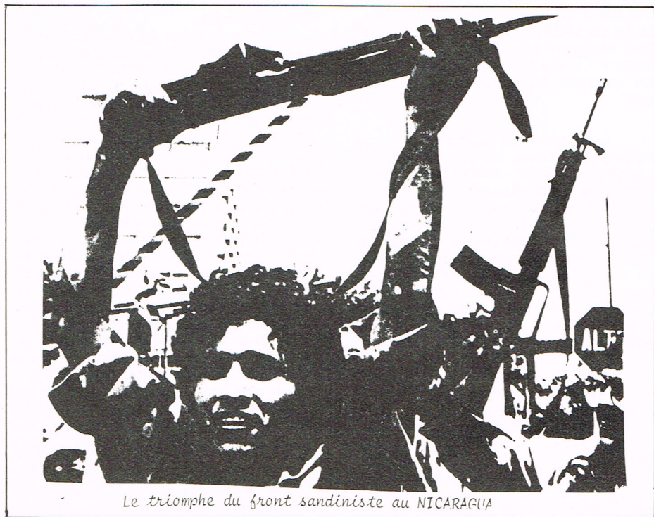
Le triomphe du front sandiniste au NICARAGUA

Le monde offre constamment des exemples qui montrent que les masses agissent avec l'assurance historique du futur. Si les masses n'avaient pas la certitude et la conviction du futur qu'il faut cons-