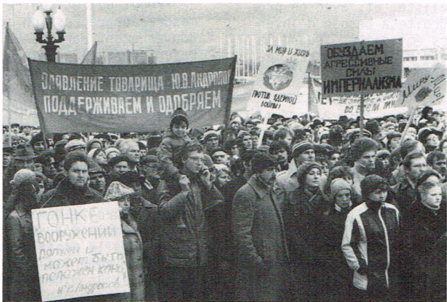
800.000 personnes manifestaient à Moscou contre la guerre et l'impérialisme américain en octobre.

J. POSADAS 2.4.1981 voir p.3 LA CEE EST LA MULTINATIONALE DES CAPITALISTES EUROPEENS