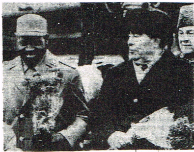
BREJNEV AVEC SAMORA MACHEL

Secrétariat International IVe Internationale-Posadiste