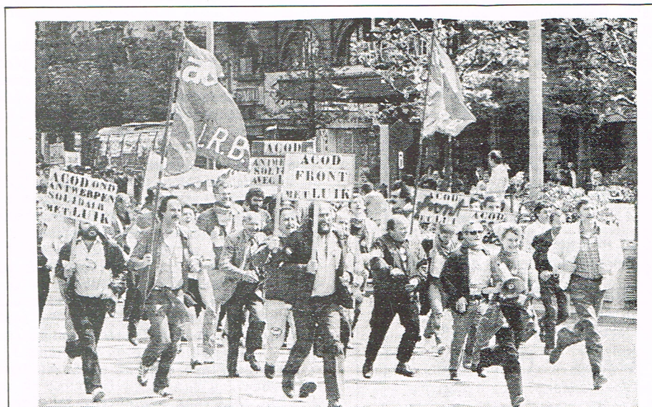
Les Liégeois n'étaient pas tout à fait seuls: à preuve cette délégation de la C.G.S.P. anversoise.