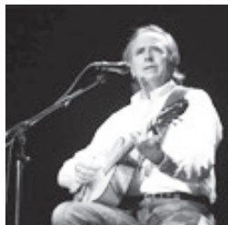
Joan Manuel Serrat