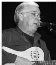
Luis Enrique Mejía Godoy

Un abala en la selva de Zinica penetró en tu recio corazón de santo y estalló tu sangre en nuestras vidas como una gigante bomba de contacto. Desbordante de amor hacia los hombres,