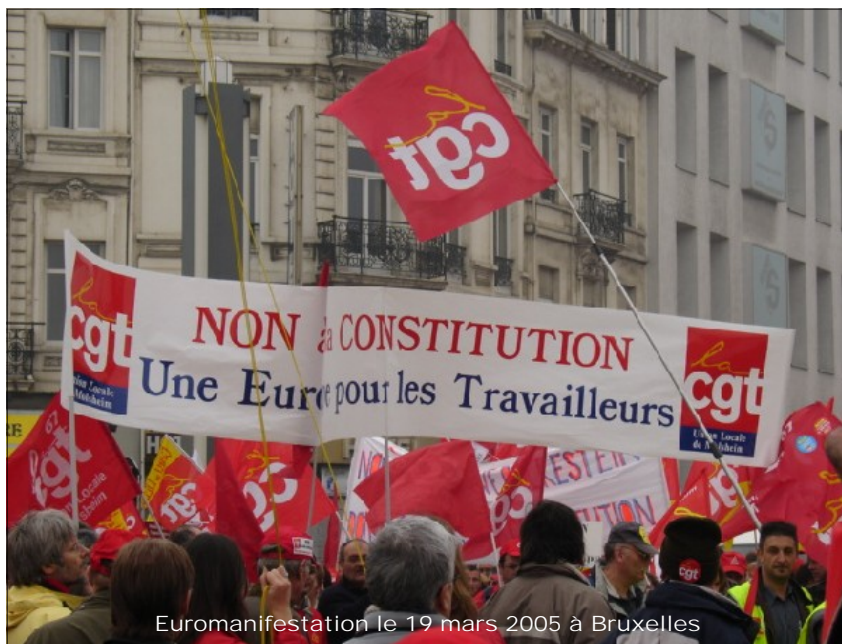
Euromanifestation le 19 mars 2005 à Bruxelles

pas le rejet du Traité Constitutionnel qui a provoqué cette crise, mais il a par contre permis d'accélérer la remise en question du processus de construction européenne parmi les pays membres. Et la prise en charge pour les six prochains mois de la présidence de l'Union Européenne par Tony Blair ne va pas améliorer cette situation, avec un projet pour l'Europe qui prévoit l'accélération du démantèlement des protections sociales, l'accroissement de la compétitivité et de la concurrence, le développement d'un partenariat avec les Etats-Unis. C'est sans doute ce programme qu'il faut considérer comme le « modèle social européen » qui doit améliorer la vie des citoyens, prôné par les partisans de l'ultralibéralisme.