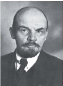
V. I. LENIN